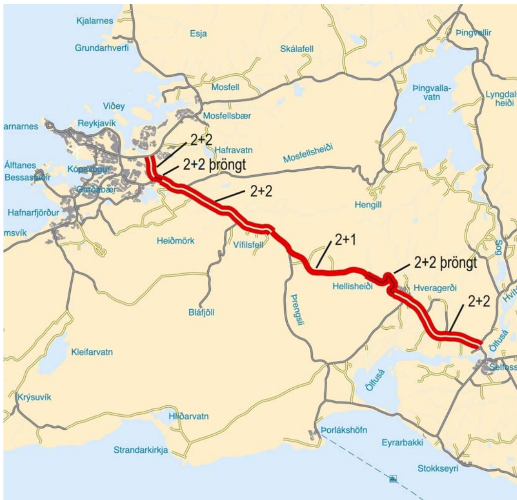
Fyrirhugað fyrirkomulag við breikkun vegarins. (Kort frá Vegagerðinni)